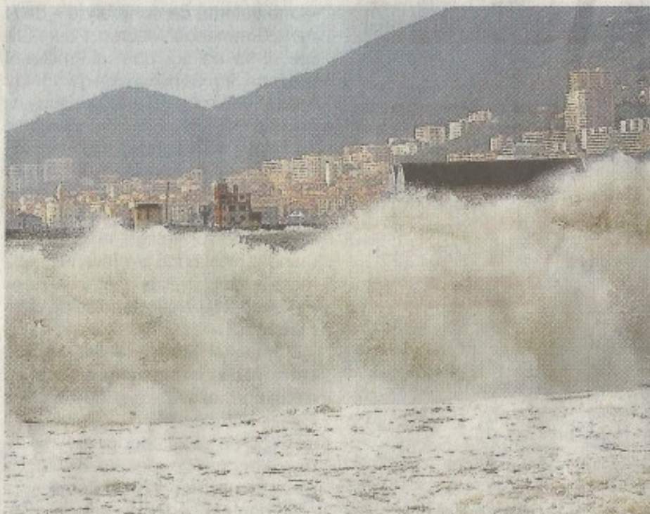
En Corse, la méditerranée déchaînée.

Des milliers de foyers ont été privés d'électricité, principalement en Nouvelle Aquitaine, jusqu'à 80 000 hier